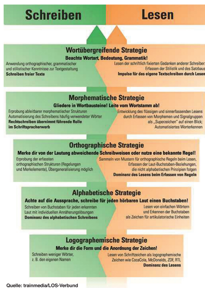
Stufenmodell nach Uta Frith

Mit schreib.on wurde auch eine Lücke in der Zielgruppe der Getesteten geschlossen. Die sonstigen Tests beschränken sich auf die Altersgruppe bis 9. Klasse. Um den